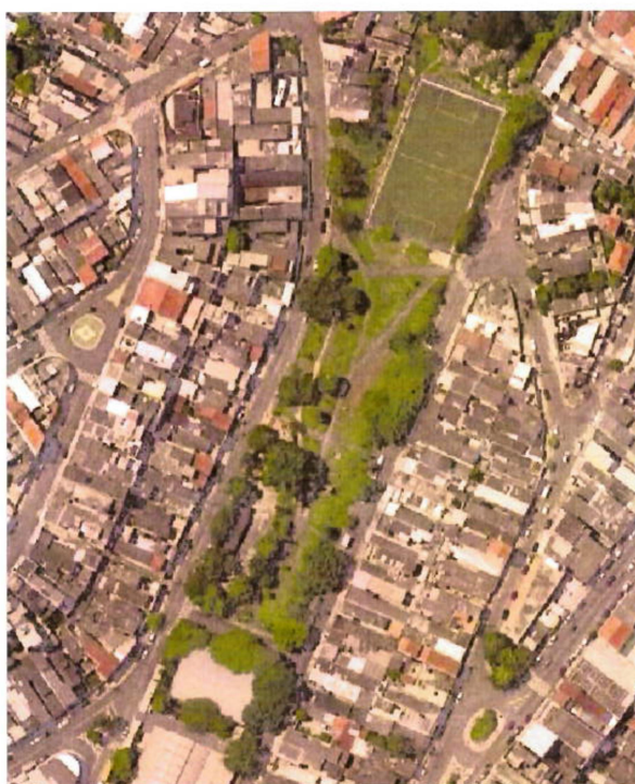
Parque Santa Brígida.

O trecho localiza-se em uma região com urbanização consolidada.