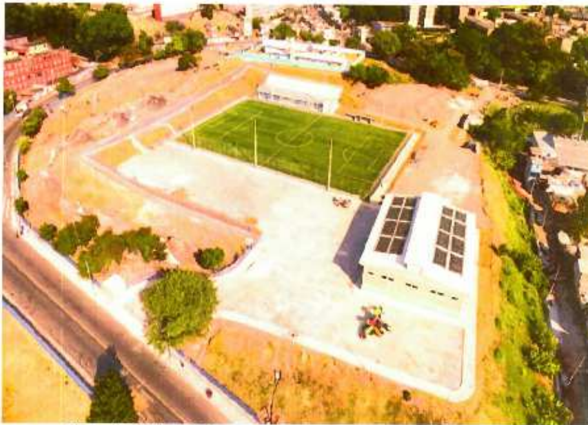
Figura 1: CEFAC COHAB BMX.