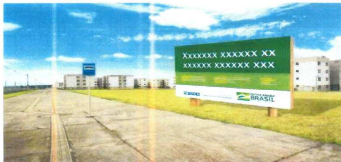
Imagem 1 – Modelo Placa de Obra

Conforme estabelecidos no site da Caixa ( https://www.caixa.gov.br/Downloads/gestao-urbana-manual-visual-placas-adesivos-obras/Manual-Placa-de-Obras.pdf ).