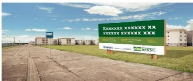
Figura 1- Placa de obra

Placa Governo Federal: Quando de instalação do canteiro de serviços, a contratada deverá mandar confeccionar e instalar, a critério do Centro de Suprimento e Manutenção de Obras (CSM/O), placa identificadora da obra, executada estritamente de acordo com o modelo fornecido pela Fiscalização (Imagem 1). É obrigatória, a instalação de uma placa, em chapas galvanizadas, para identificação da obra, de 3 metros de altura por 6 metros de comprimento, totalizando dezoito metros quadrados. Conforme estabelecidos no site da Caixa (( https://www.caixa.gov.br/Downloads/gestao-urbana-manual-visual-placas-adesivos-obras/Manual-Placade-Obras.pdf )).